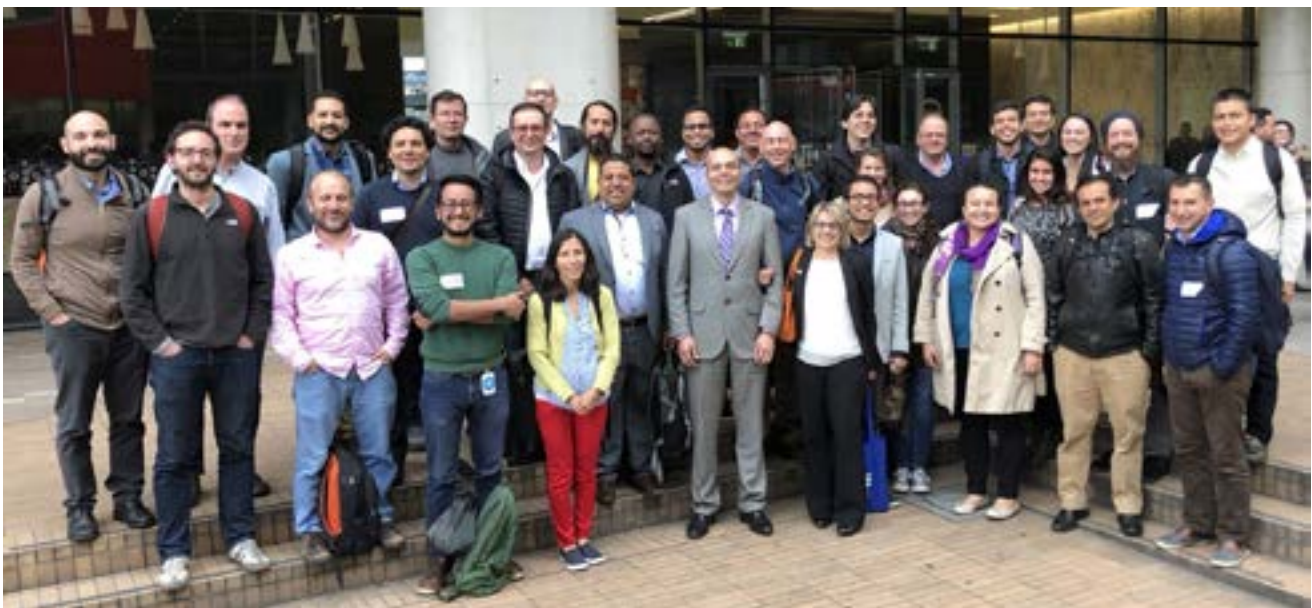
Representantes en el taller de C3Biodiversidad realizado en Bogotá, junio de 2018.

C3Biodiversidad (Consortio Colombiano de Ciberinfraestructura para la Biodiversidad) tiene el objetivo de desarrollar una infraestructura computacional en Colombia para el análisis de datos científicos. Creada en Bogotá el 28 de junio de 2018 por un panel de expertos del Sistema de Ciencia, Tecnología e Innovación de Colombia, junto con expertos internacionales, C3Biodiversidad está abierta a cualquier parte interesada en desarrollar dicha ciberinfraestructura en Colombia.